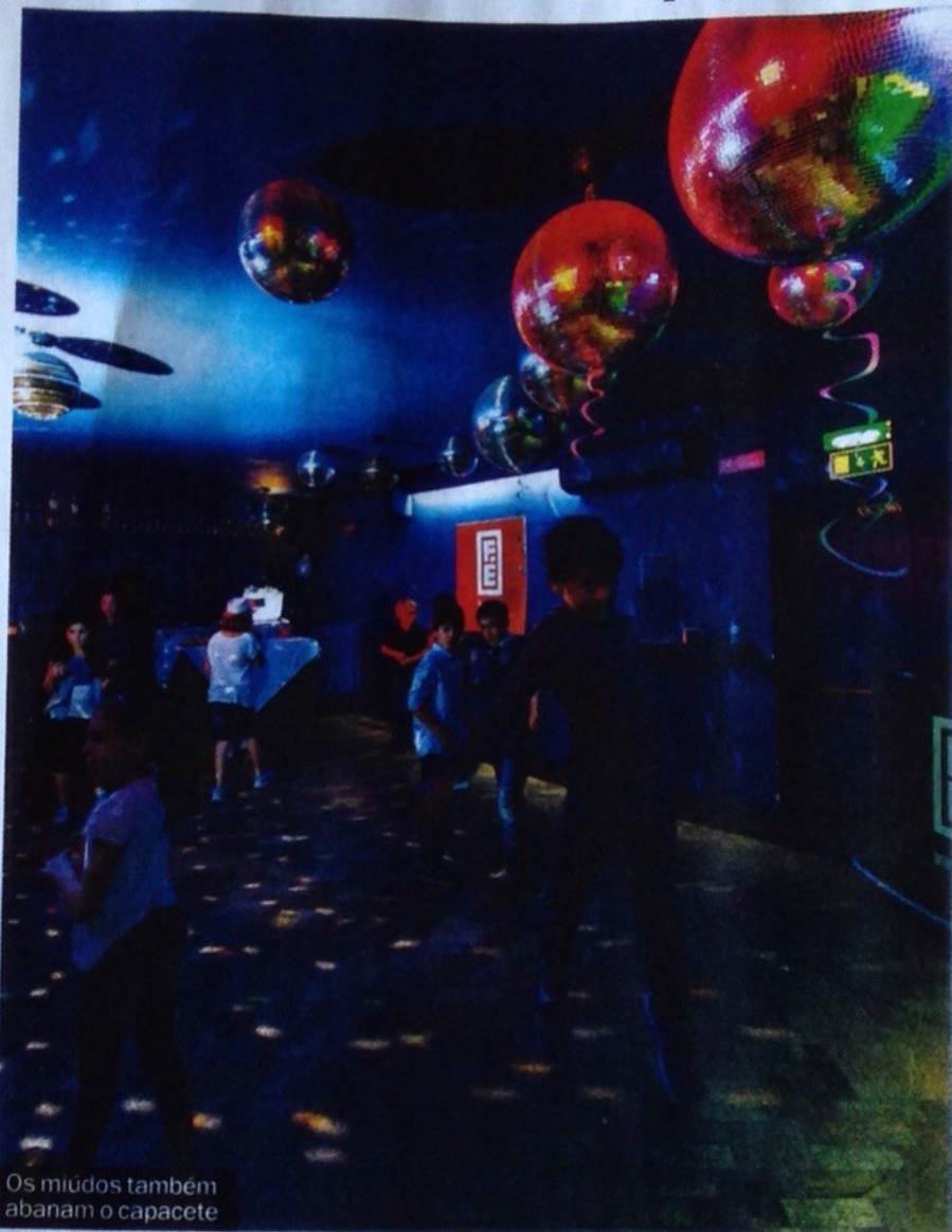
Os miúdos também abanam o capacete